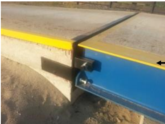
Arretierung an der Rampe